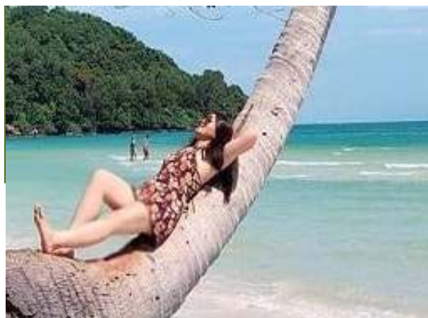
Cua Can strand