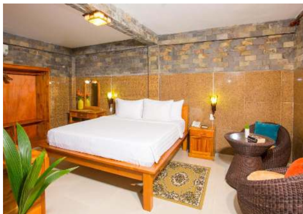
Chez Carole Resort, dobbeltværelse